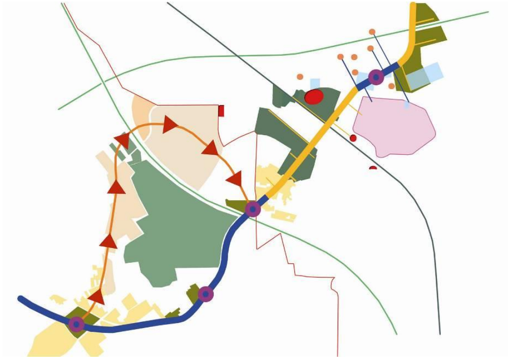
Figura 2 - Schema strategico di progetto

In questa strategia generale di riqualificazione urbana, è stata poi pensata una densificazione mitigata, in particolare collegata e indotta dalla costruzione delle nuove stazioni di Strocchia e Feudo, da affiancare a quelle esistenti di Nola e Saviano, con l'intento di ricucire le trame del territorio agricolo storico, i frammenti di tessuto insediativo e di coordinare le previsioni dei diversi Prg, con l'obiettivo di dare vita ad un tessuto urbano multifunzionale e interconnesso con il sistema territoriale.