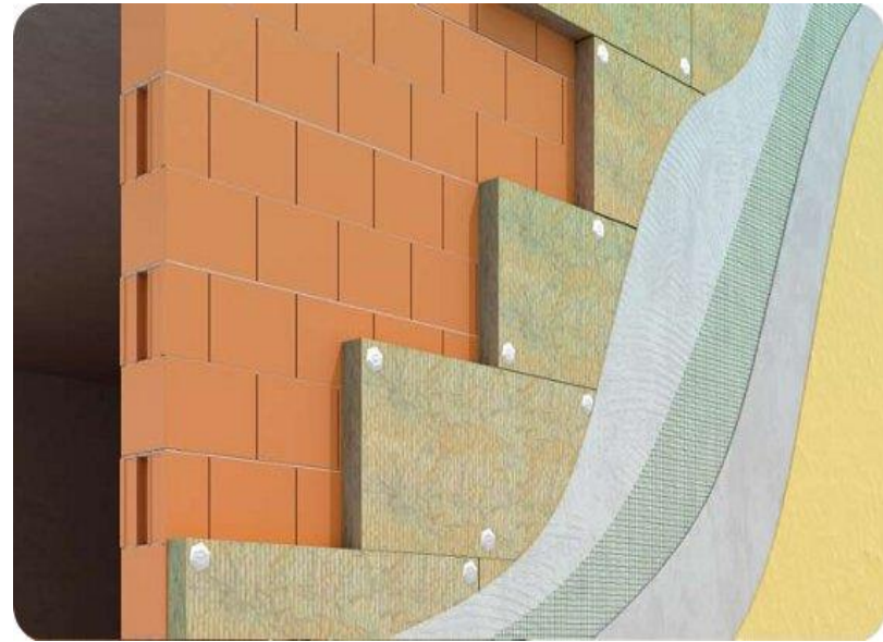
- Esempio di isolamento a cappotto ( www.solida.termolan.it ): ottima attenuazione