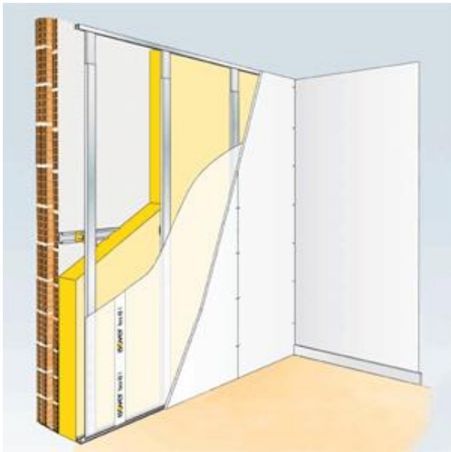
Esempio di isolamento interno: scarsa attenuazione