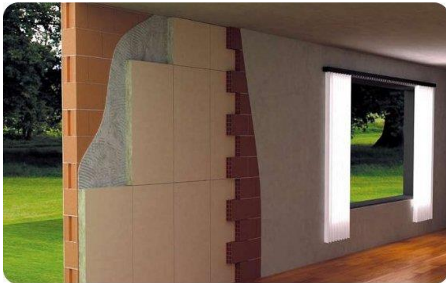
Esempio di isolamento in intercapedine ( www.solida.termolan.it ): solo la fodera interna contribuisce all'attenuazione