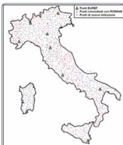
Figura 1 - Rete IGM95 all'impianto (1996).