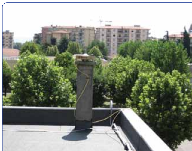
Figura 3 - Stazione GPS permanente dell'IGM.

Nella scelta delle stazioni permanenti si è cercato di ottenere un'uniforme distribuzione, con particolare riguardo alle zone marginali del territorio, evitando al contempo i siti affetti da sensibili movimenti locali. L'interdistanza fra le stazioni è variabile fra i 100 e i 150 km. Sono state incluse nel network 13 stazioni EUREF, indispensabili per l'allineamento all'ETRF2000; fra queste è presente la stazione dell'IGM (fig. 3) ufficialmente riconosciuta dall'EUREF dal marzo 2007 ed inclusa nell'EPN (EUREF Permanent Network - fig. 4). Sono state incluse inoltre le stazioni dell'ASI (Agenzia Spaziale Italiana), una parte di quelle dell'INGV (Istituto Nazionale di Geofisica e Vulcanologia), oltre ad alcune stazioni per ciascuna Regione, in