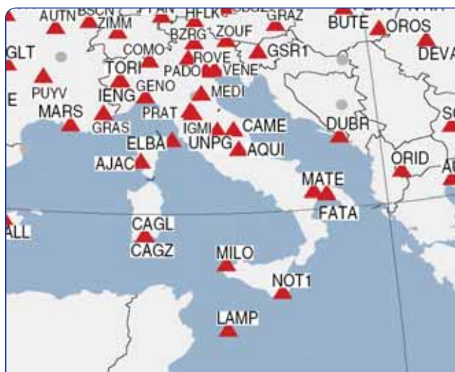
Figura 4 - EUREF Permanent Network nel 2008.