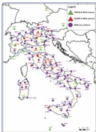
Figura 2 - Rete Dinamica Nazionale.

La rete IGM95 fu calcolata in appoggio alle 9 stazioni dell'EPN (EUREF Permanent Network) presenti allora sul territorio nazionale, per le quali l'EUREF forniva le coordinate ETRF89, e precisamente: Monte Generoso, Mondovì, Monte Grappa, Medicina, Firenze (IROE), Roma M. Mario, Matera, Noto e Cagliari. La precisione della rete risultò ottima: gli errori quadratici medi delle coordinate forniti dal calcolo di compensazione, espressi a livello di confidenza del 95%, erano pari a 2,5 cm per la planimetria e 4 cm per la quota.