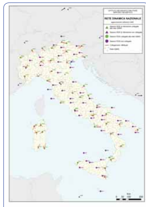
Figura 6 - Collegamenti fra i punti dell'IGM95 e le stazioni dell'RDN.

Il discorso è equivalente a quello già fatto per l'IGM: le differenze fra ETRF2000 e ETRF89 incidono solo sulle determinazioni geodetiche e non sulla georeferenziazione degli oggetti tipica della cartografia e dei GIS, nemmeno se si considerano le scale tipiche della carta tecnica. Noi infatti consigliamo a tutti i produttori di tali dati di dichiarare il Sistema ETRS89 senza indicare la Realizzazione; le Realizzazioni possono variare nel tempo, ma presentano differenze a cui i loro dati non sono sensibili. A tal proposito il Servizio Geodetico dell'IGM ha posto recentemente in