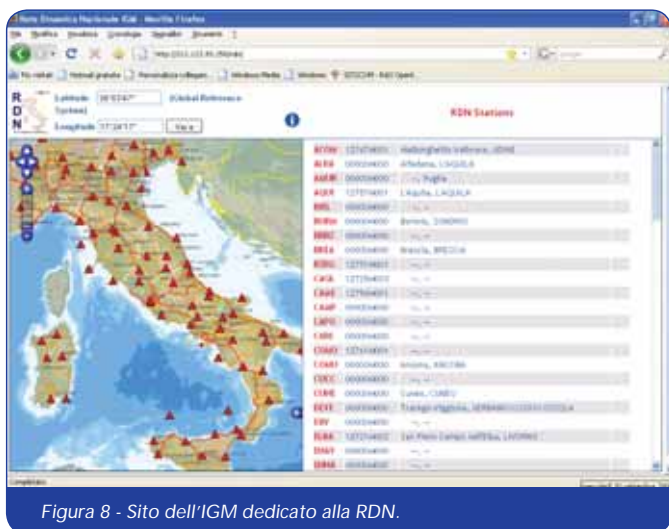
Figura 8 - Sito dell'IGM dedicato alla RDN.

INTERVISTA A CURA DI RENZO CARLUCCI DIRETTORE@RIVISTAGEOMEDIA.IT