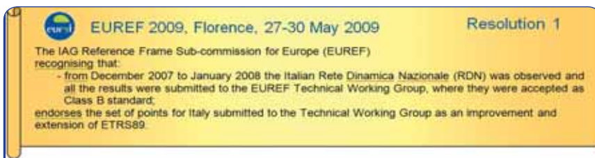
Figura 5 - Approvazione ufficiale della RDN Italiana nel network europeo (2009)

modo da poter trasferire a tali Enti, gestori del posizionamento in Tempo Reale, il Riferimento nazionale.